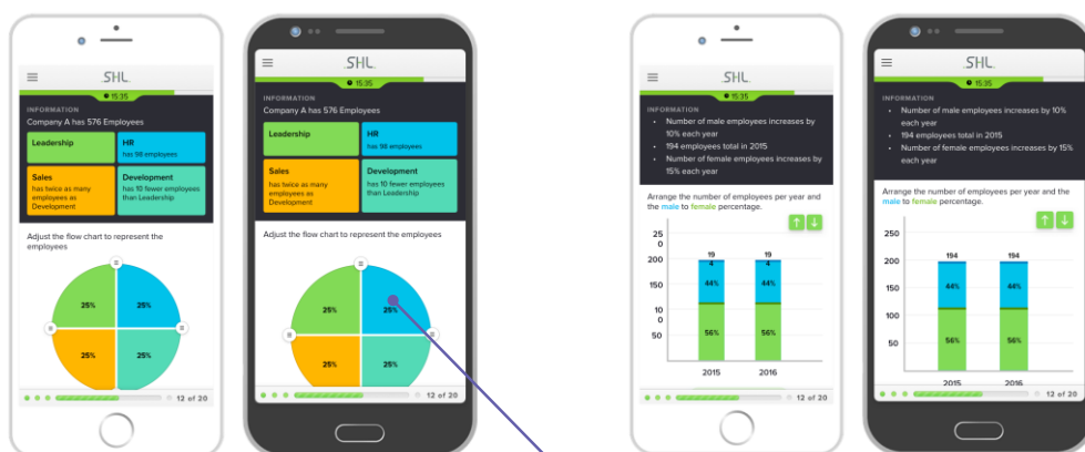
Aggiusta il grafico facendo scorrere i segmenti